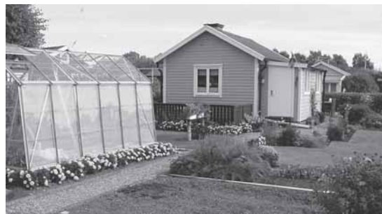
Bild 3. Räkneexempel. Odlarna i studien är hypotetiska exempel som räknats fram bl a efter intervjuer med rådgivare och odlare.

linggödseln, baseras på siffror som kommer från producenterna. Halterna av växtnäring i stallgödseln är uträknade utifrån schablonvärden, vilket alltid ger en viss osäkerhet.