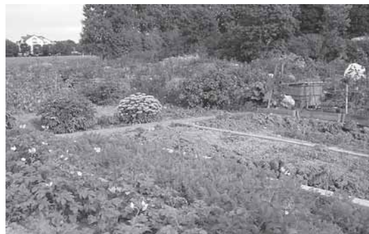
Bild 4. Dubbelt upp. Mängden gödsel som sprids på grönsaker och rabatter i koloniträdgården är dubbelt så mycket som tillförs en spannmålsodling i lantbruket.

Om man slår ut gödseltillförseln på den sammanlagda odlingsytan, det vill säga utan arealen för byggnader och hårdgjorda ytor,