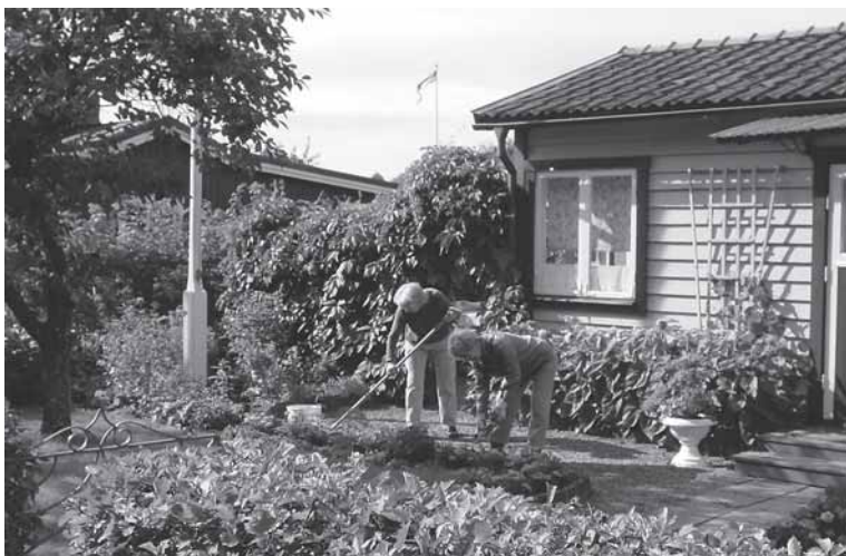
Bild 1. Vanlig syssla. Näst promenader är trädgårdsarbete det som sysselsätter flest svenskar utomhus på fritiden.

Å andra sidan kan man tro att risken för att fritidsodlare ska övergödsla är liten bl a för att gödselmedel kostar pengar och måste fraktas till odlingen.