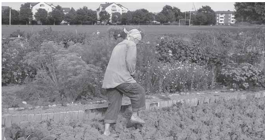
Bild 2. Hur mycket gödsel? Det saknas samlad kunskap om hur mycket gödsel fritidsodlarna använder.