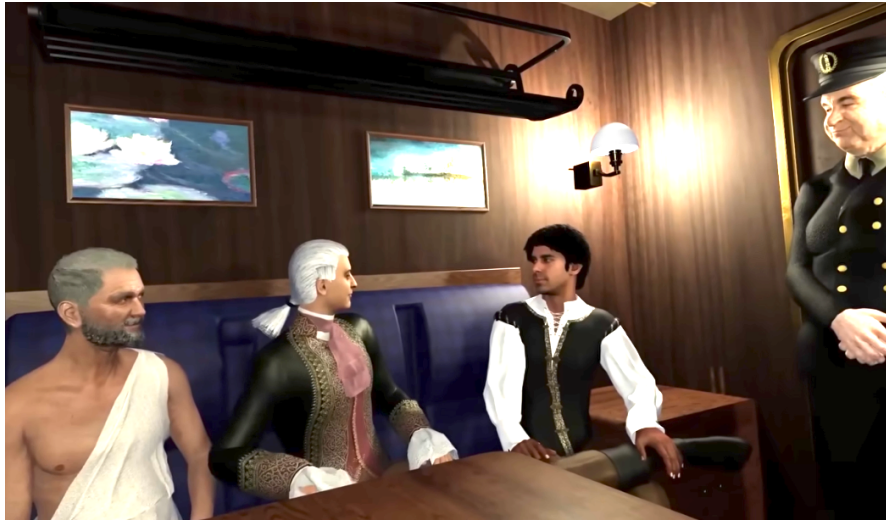
Figur 1. Skärmlapp från videon "Reverse Turing Test Experiment with AIs" på Youtube.